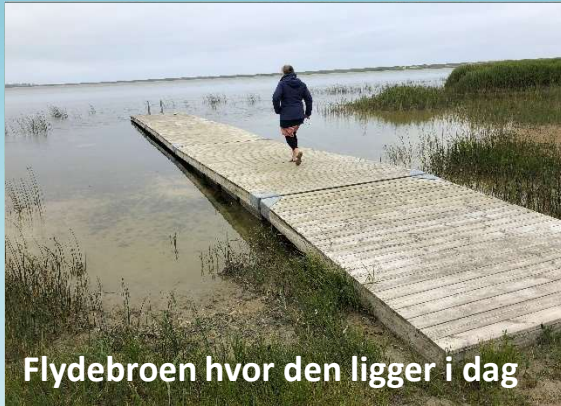
Flydebroen hvor den ligger i dag